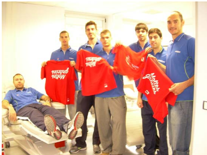
Moment en què jugadors del Club de Bàsquet Tarragona van visitar el Banc de Sang de l'Hospital Universitari de Tarragona Joan XXIII

Aquesta és la primera iniciativa que s'ha dut a terme arran d'un conveni de col·laboració que es va signar a finals de 2011 entre el Banc de Sang i el Club de Bàsquet Tarrago-