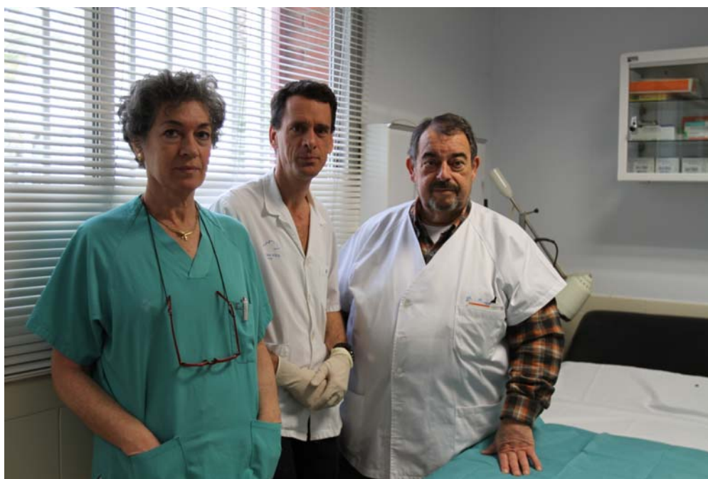
Equip del Servei de Traumatologia de l'Hospital Universitari Joan XXIII, encarregat d'implantar el nou tractament per a la rigidesa del palmell de la mà