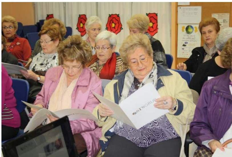
Moment de la sessió Dona i Envelliment, organitzada per l'Associació Dones 2000 de Reus

dona i vellesa, i recursos assistencials per a persones grans amb dependència. Podeu consultar aquesta proposta a l'adreça http://bit.ly/GGDUdf , o sol·licitar més informació a STS Grup.