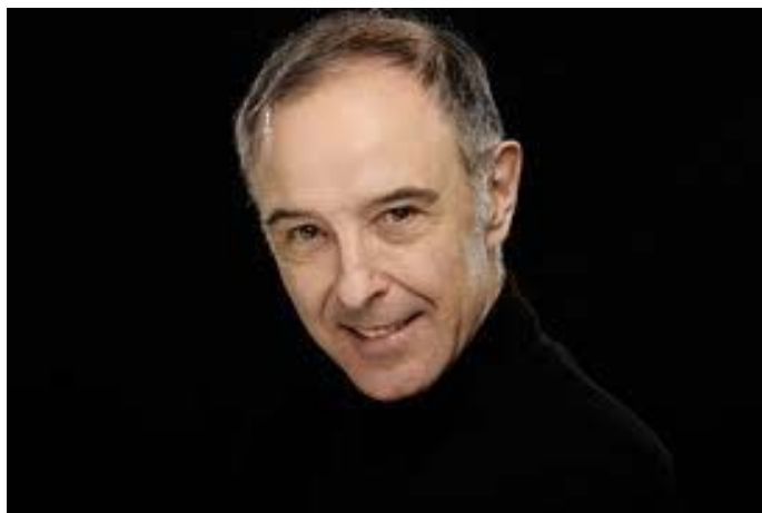
Imatge de l'actor Manel Barceló, que representarà l'obra Els dolents de Berkoff, on interpretarà els 80 personatges malvats de William Shakespeare

Junta Rectora Col·legi Oficial de Psicòlegs de Catalunya. Delegació de Tarragona